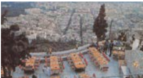
Akropolis, studenti na výletě, studenti ve třídě a pohled na Athény