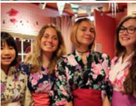
Budova školy, Kóbe a studenti školy Lexis při výletech a aktivitách