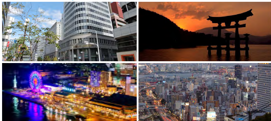
Budova školy, Kóbe