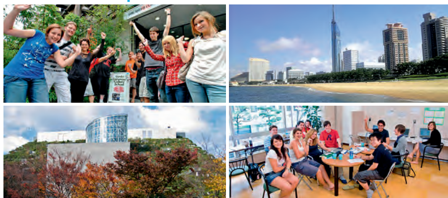
Studenti před budovou školy, Fukuoka a studenti v klubovně školy