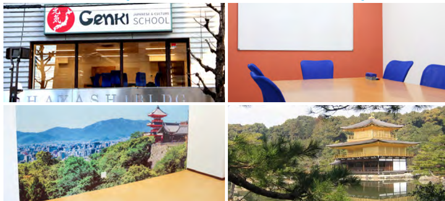
Budova školy, třída a Kjóto