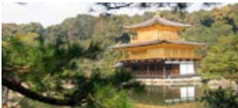
Budova školy, třída a Kjóto