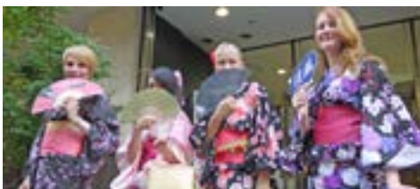
Budova školy, studenti ve třídě, na výletě a při aktivitách