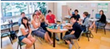
Studenti před budovou školy, Fukuoka a studenti v klubovně školy