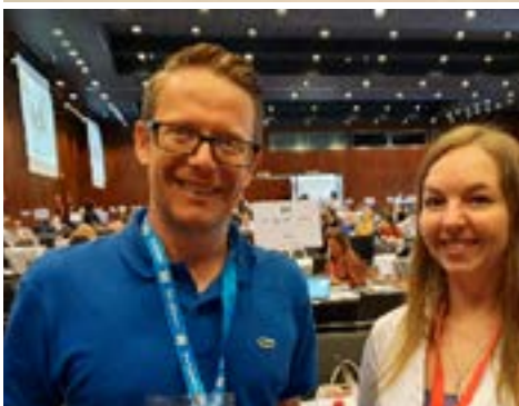
Singapur, pláž v zábavním parku Sentosa, Park Sentosa, zaměstnanci školy