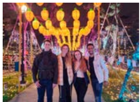
Škola v Tchaj-pej, výuka, Tchaj-čung a studenti ve volném čase