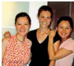
Hodina kaligrafie, Velká čínská zeď a studentky školy