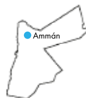
Ammán, studenti při výuce, skalní město Petra a třída