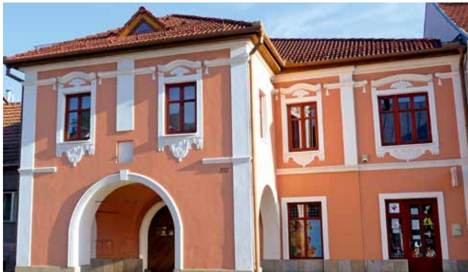
Budova CA INTACT - studium v zahraničí, s.r.o., Hornoměstská 357, Velké Meziříčí

nebo běžných linkách 566 521 441, 566 521 442, 736 488 556 . Těšíme se na Vás!