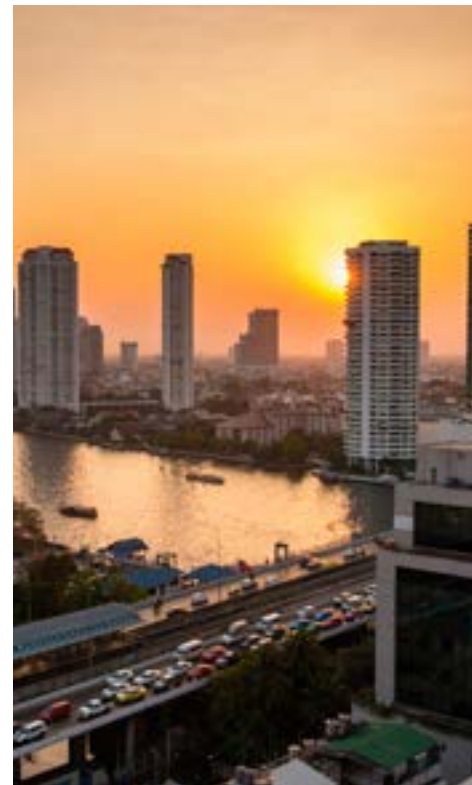
Les v Bankoku, studenti školy, hotel Furama Asok, studenti ve volném čase