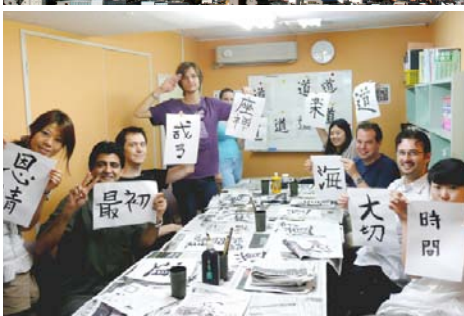
Studenti v klubovně, Tokio, univerzita, lecke kaligrafie