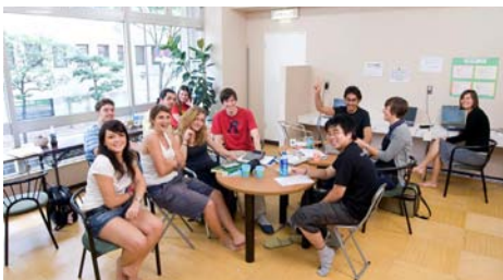
Studenti před budovou školy, Fukuoka, Festival Hakata, studenti v klubovně školy