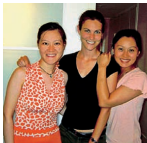
Hodina kaligrafie, Velká čínská zeď a studentky školy