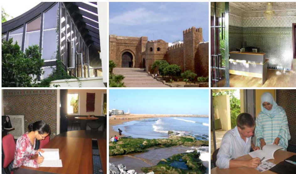
Budova školy, Palace Gate, recepce školy, studentka ve škole, pláž, individuální výuka