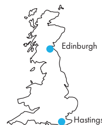
Hrad v Edinburghu, budova školy v Hastingsu, třída a studenti na výletě