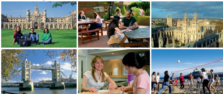
Studenti v Cambridge, terasa v Bournemouth, Oxford, Tower Bridge v Londýně, recepce školy a studenti na pláži v Bournemouth