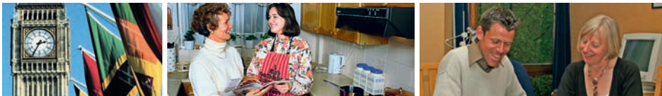
Londýn a výuka v domě učitele