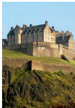
Budova školy EAC Hastings, klienti školy EAC Hastings a hrad v Edinburghu