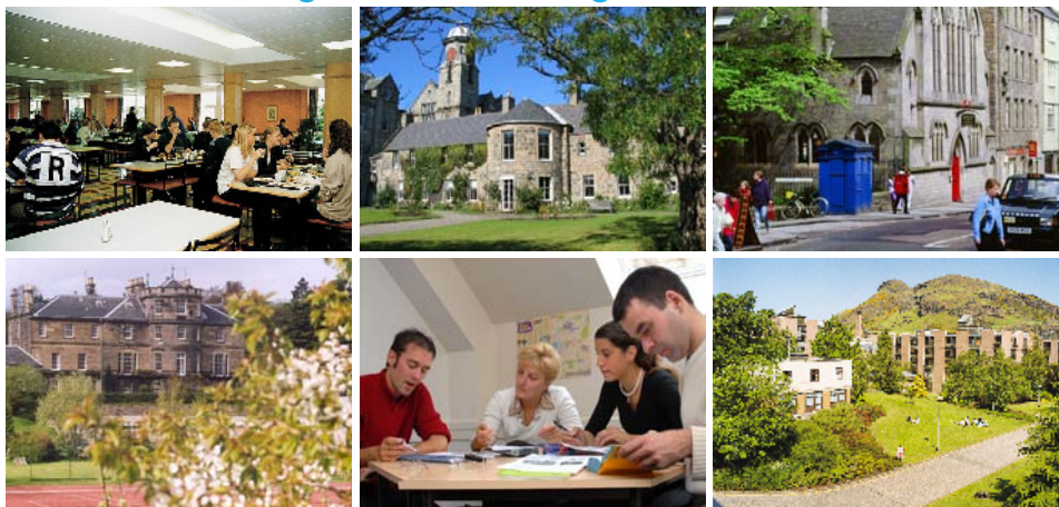
Studenti v jídelně, budova školy, Craston House, Mary Erskine, studenti při výuce, ubytovna Pollock Halls.