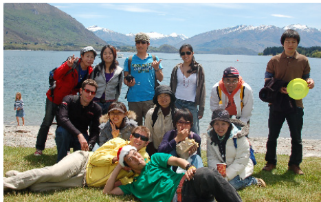
Pohled na Queenstown a studentů na výletě