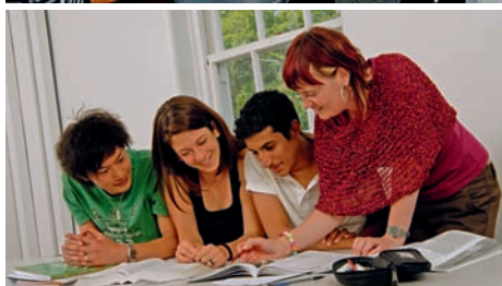
Studenti před budovou školy v Aucklandu, výuka, počítače v Aucklandu, výuka