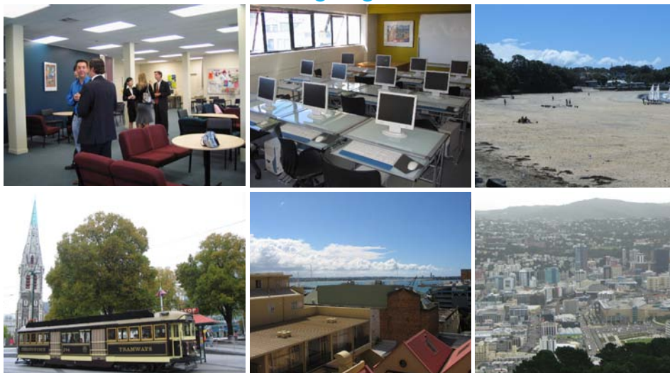
Společenská místnost, multimediální učebna, pláž v Aucklandu, tramvaj v Christchurchi, pohled ze školy, Auckland