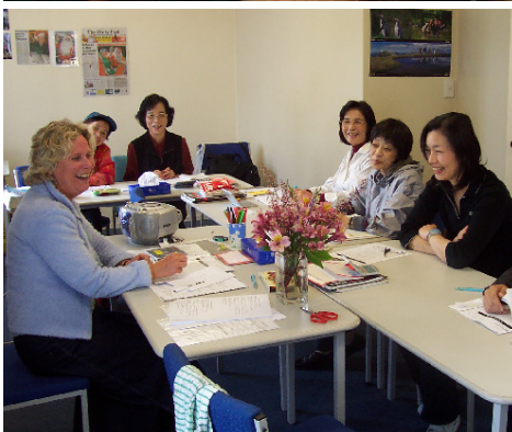
Příroda v okolí Rotorua, maorský folklórní tanečník, školní výlet a výuka