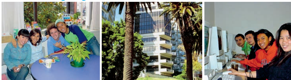
Studenti školy, budova školy LSI v Aucklandu a studenti v počítačové učebně