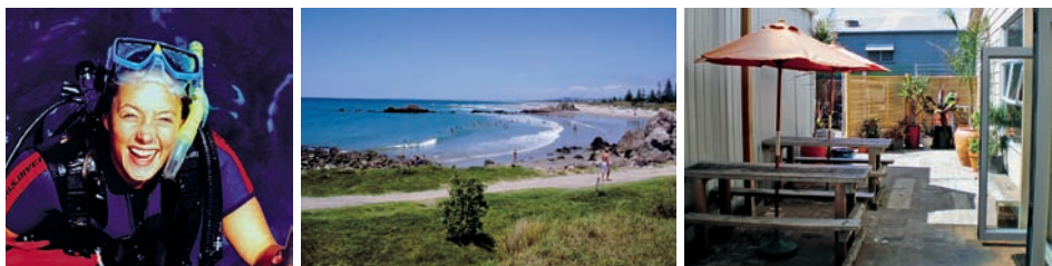
Pohled na Mt. Maunganui, výuka, třída, potápěčka, pláž v Mt. Maunganui a školní dvorek