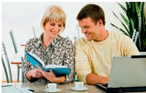
Klient v hostitelské rodině, výuka