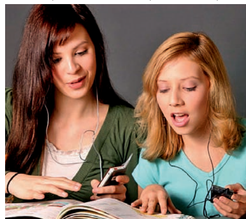
Výuka - kurzy HLI

Během pobytu se studentům nabízí řada kulturních a společenských aktivit v závislosti na místě, kde studují. Můžete chodit do kin a divadel, můžete hrát např. golf, fotbal, tenis, jezdit na kole apod. Výběr aktivit samozřejmě velmi záleží na vybrané rodině učitele a lokalitě. Z tohoto důvodu je velmi důležité, abyste Vaše požadavky na různé sporty a na hostitelskou rodinu uvedli do přihlášky v kolonce "Služby za příplatky a zvláštní požadavky". Kurz „jako v bavlnci“ prosím plánujte s delším předstihem, nejlépe dva měsíce předem, abychom zajistili lokalitu a termín podle Vašeho přání.