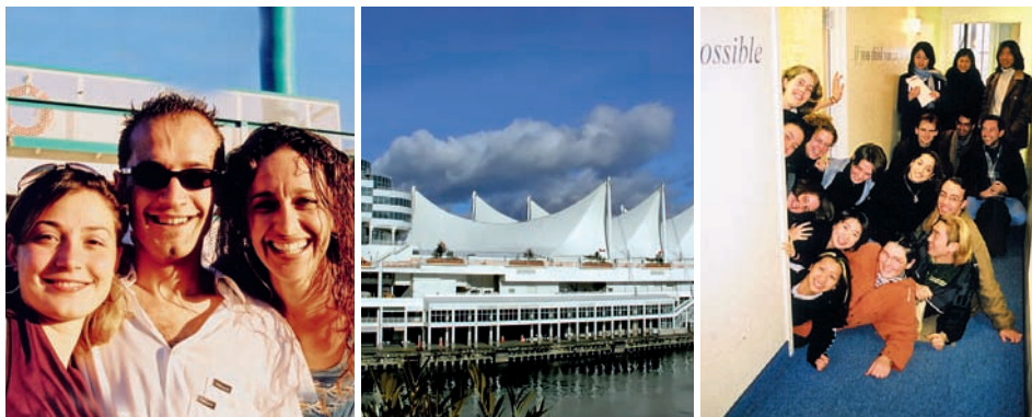
Studenti školy ILAC Toronto, Canada Place ve Vancouveru a studenti školy o přestávce na chodbě