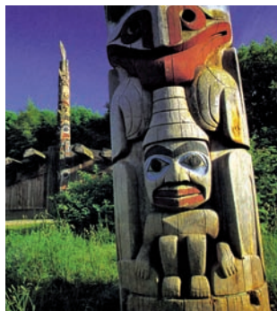
Studenti školy v Torontu v počítačové učebně, Vancouver a indiánský totem