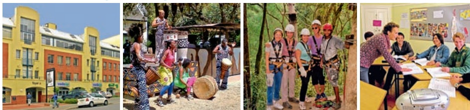
Budova školy Inlingua Cape Town, taneční vystoupení, studenti při aktivitách a při výuce.