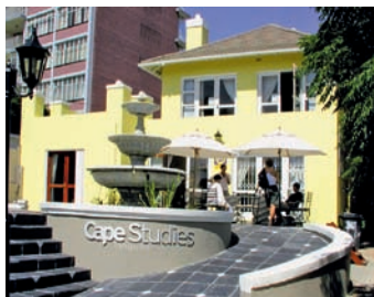
Pohled na Kapské Město, zaměstnanci školy v recepci a budova školy