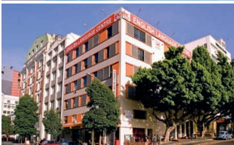
Klubovna školy, Stolová hora, studenti při výuce, budova školy EC Cape Town